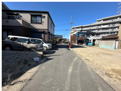
敷地内に電柱が入ります。